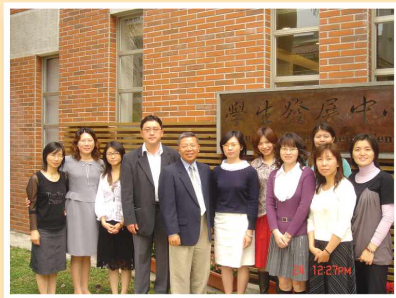
學務長及學生發展中心的師長們