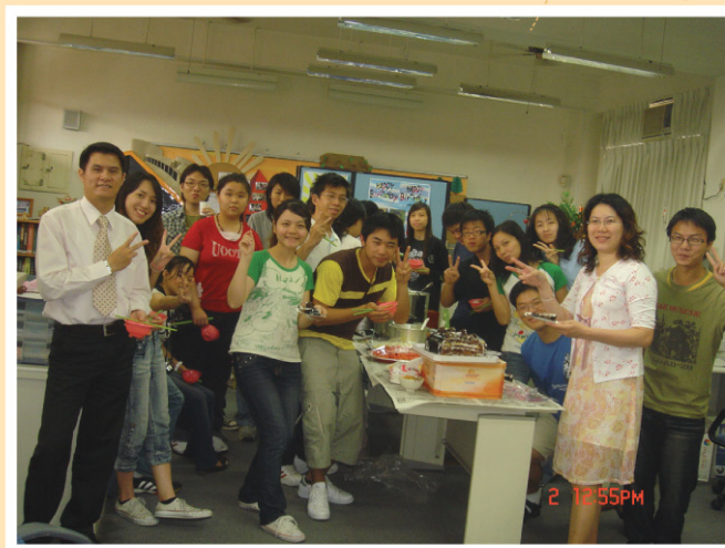
資萃夥伴齊聚一堂...別忘了取鏡頭的小媽老師ㄟ!