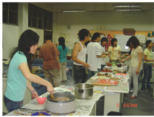
未來的天下第一味